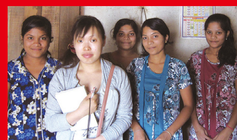
フィールド調査の様子 A photo of actual fieldwork. 实地调查照片